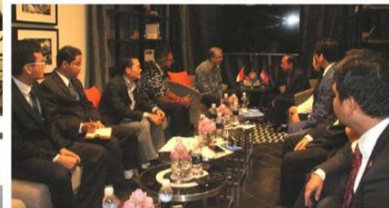
ALA Special Meeting “ALA Institute for Harmonization of Law”, Siem Reap, Cambodia (7 – 9 June 2018)

As the youngest ALA national committee to be established, ALA Cambodia was honored to be the host country and the co-host for a special meeting of ALA, “ALA Institute for Harmonization of Laws” which was held on 8 June 2018 at Shinta Mani Hotel, Siem Reap, Cambodia. Delegates from 7 ASEAN countries attended this historic meeting (in