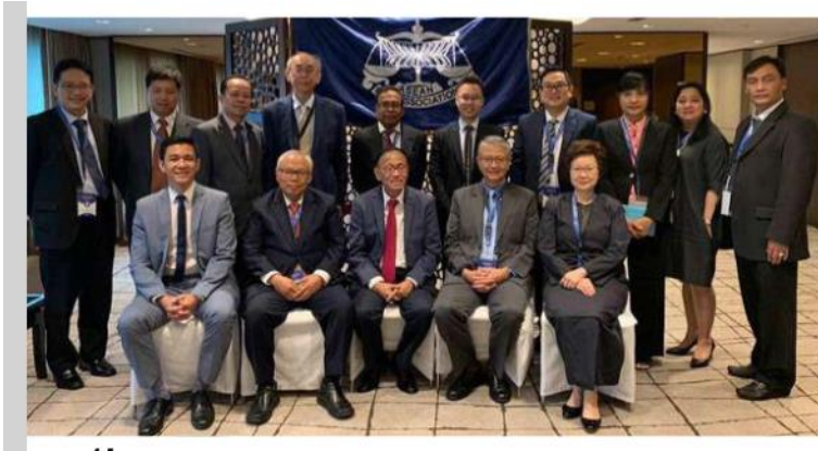
Launch of ASEAN Law Institute, Manila, Philippines (13 April 2019)

ចូលរួមការបង្កើតវិទ្យាស្ថានច្បាប់អាស៊ាន (ASEAN Law Institute) នៅប្រទេសហ្វីលីពីន